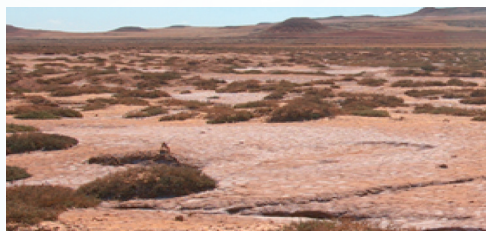
Αίτια μεταβολής ενός «υγιούς» υποδείγματος βλάστησης (αριστερά) σε υποβαθμισμένο τοπίο;