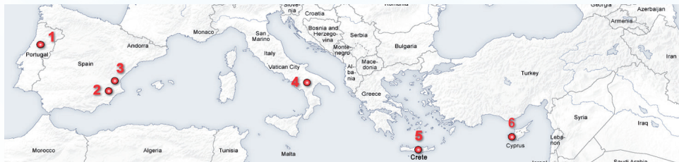
Οι περιοχές μελέτης του CASCADE. 1 = οροσειρά του Caramulo, Πορτογαλία· 2 = οροσειρά Albutera, Αλικάντε, Ισπανία· 3 = οροσειρά Mariola, Ισπανία· 4 = Castelsaraceno, Ιταλία· 5 = Κοιλιάδα Μεσσαράς, Κρήτη· 6 = υδροφόρος Πέγαιος, Πάφος, Κύπρος

Το CASCADE θα εξετάσει έξι περιοχές μελέτης στη νότια Ευρώπη, όπου έχουν παρατηρηθεί μεταβολές των οικοσυστημάτων ή είναι πιθανό να παρατηρηθούν, με συσχετισμένες συνέπειες για τη βλάστηση, τα ζώα, και τους ανθρώπους που ζουν εκεί. Οι τοποθεσίες των περιοχών αυτών φαίνονται παρακάτω.