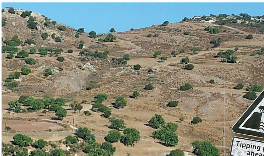
Μερικώς υποβαθμισμένο τοπίο, Ρεγιά, Κύπρος (φωτογραφία: Κ. Θεμιστοκλέους)

Οι ερευνητικοί εταίροι του CASCADE επιδιώκουν να συγκεντρώσουν την εμπειρογνομosύνη τους και να εκμεταλλευτούν στο έπακρο τις ευκαιρίες διενέργειας πειραμάτων. Απώτερος στόχος είναι η πρόληψη αιφνιδίων μεταβολών στα οικοσυστήματα ξηρότοπων. Ο στόχος αυτός βρίσκεται σε αρμονία με διεθνείς προσπάθειες, ειδικότερα εκείνες τις Σύμβαςης των Ηνωμένων Εθνών για την Καταπολέμηση της Ερημοποίησης (UNCCD). Η UNCCD είναι αφοσιωμένη στην παγκόσμια αποκατάσταση υποβαθμισμένων περιοχών και στην αποφυγή περαιτέρω υποβάθμισης του εδάφους. Το έργο CASCADE θα συμβάλει στην υποστήριξη του στόχου της UNCCD για «έναν κόσμο μηδενικής υποβάθμισης της γης».