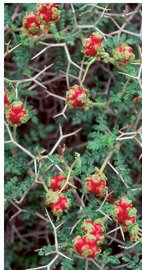
Αγρωστώδη και θάμνοι στην περιοχή της Πέγειας, στην Κύπρο (Φωτογραφία του Κ. Θεμιστοκλέους, 2012)