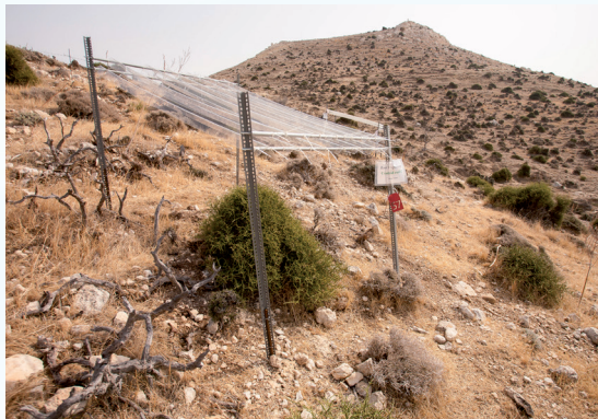
Πειραματικά τεμάχια και στέγαστρα για την προσομοίωση ξηρασίας