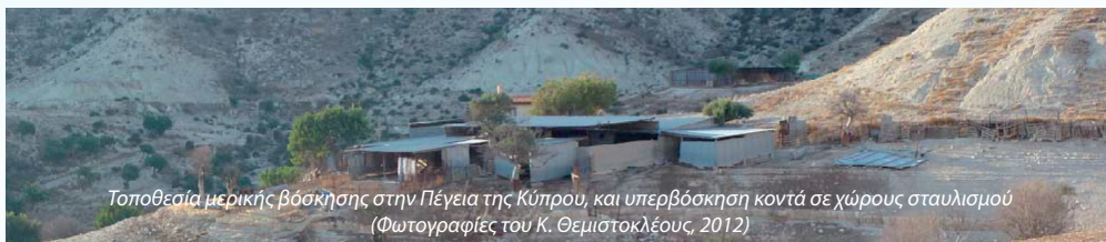
Τοποθεσία μερικής βόσκησης στην Πέγεια της Κύπρου, και υπερβόσκηση κοντά σε χώρους σταυλισμού (Φωτογραφίες του Κ. Θεμιστοκλέους, 2012)

Οι τρέχουσες γνώσεις σχετικά με τα αίτια και τα χαρακτηριστικά των αιφνίδιων μεταβάσεων σε μεσογειακούς ξηρότοπους είναι περιορισμένες, επομένως εξακολουθεί να είναι δύσκολη η πρόβλεψη κατά πόσον και πότε πρόκειται να σημειωθεί μετάβαση. Όποτε μια μετάβαση φαίνεται να είναι ανεπιθύμητη για τους χρήστες της γης είναι δύσκολο να γνωρίζουμε κατά πόσον είναι δυνατή η λήψη μέτρων για την αποτροπή της. Το έργο CASCADE θα συλλέξει πειραματικά δεδομένα, θα τα χρησιμοποιήσει σε οικολογικά μοντέλα, και θα ερμηνεύσει τα αποτελέσματα, προκειμένου να προσφέρει περαιτέρω γνώσεις σχετικά με τα ακόλουθα ερωτήματα: